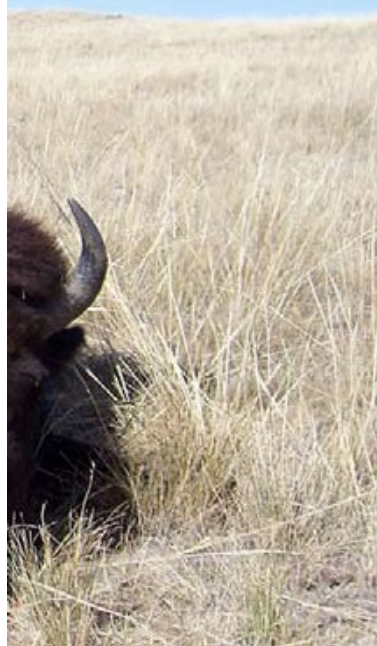
Första jakten för kära hustrun och den gav mersmak. Notera ingångshålet som är något högt, men varför klaga när verkan var god?

Skulle verkligen fabriksammunitionen fälla en bison? Trots allt vägde de runt ett ton. Fast indianerna hade använt pilbåge och general Custer sin .45 Colt