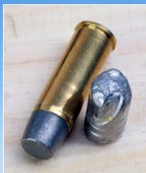
Före och efter. Kulan, som hittades under skinnen efter djup penetration, har roterat mot bogbladet utan att splittras, vilket visar vikten av bra legering. Kulorna, som väger 335 grains, har en mix av 92 % bly, 6 % antimon och 2 % tenn, om nu någon vill gjuta egna blydaggas.